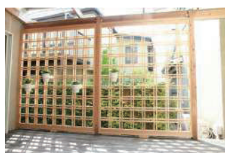
広いメインテラスは荷物おき、移動スペースと何かと便利