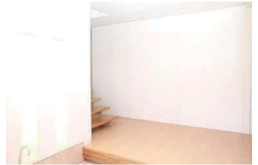
玄関用の壁があります。簡単な設置で階段を隠したり、テラスを隠したりできます。