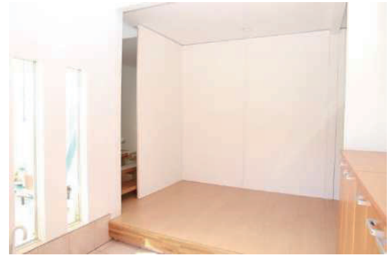
詳しくはスタッフにお声がけください。